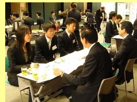
（第二回開催時の情報交流会の様子）