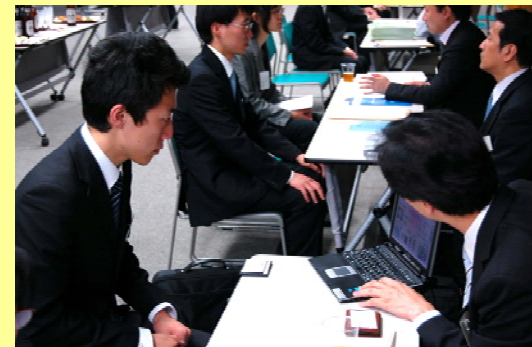
（第一回開催時の情報交流会の様子）