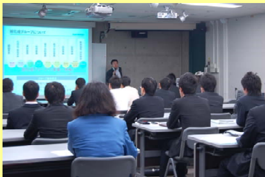
（第一回開催時の企業セミナーの様子）