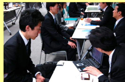
（第一回開催時の情報交流会の様子）